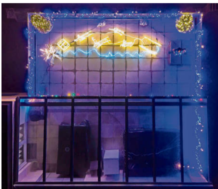
Luftaufnahme eines Sitzplatzes mit Weihnachtsbeleuchtung in Volketswil.