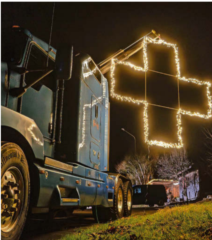
Schweizer Lichtkreuz in Hasel.