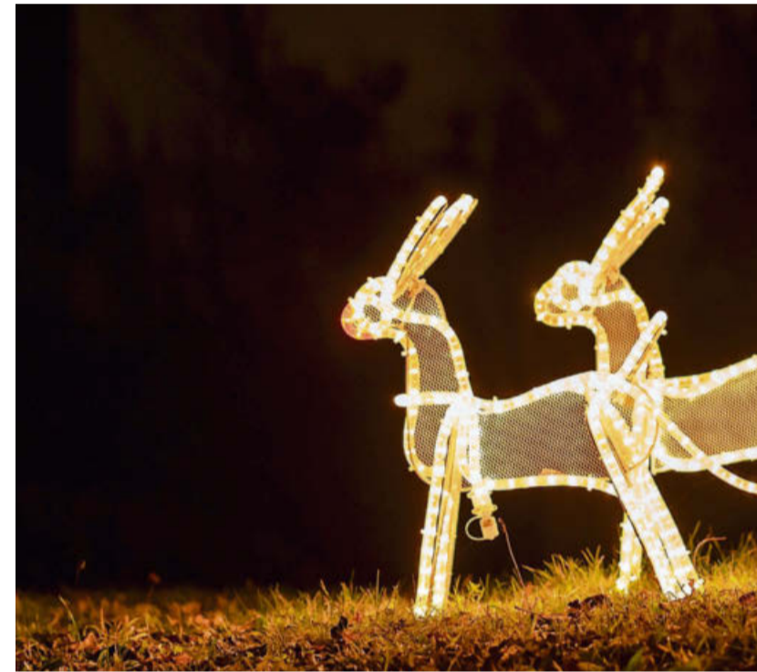
Diese Rentiere sind in Dübendorf unterwegs.