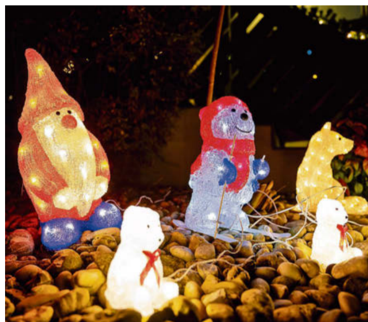
In Benglen mag man es bunt und tierisch.