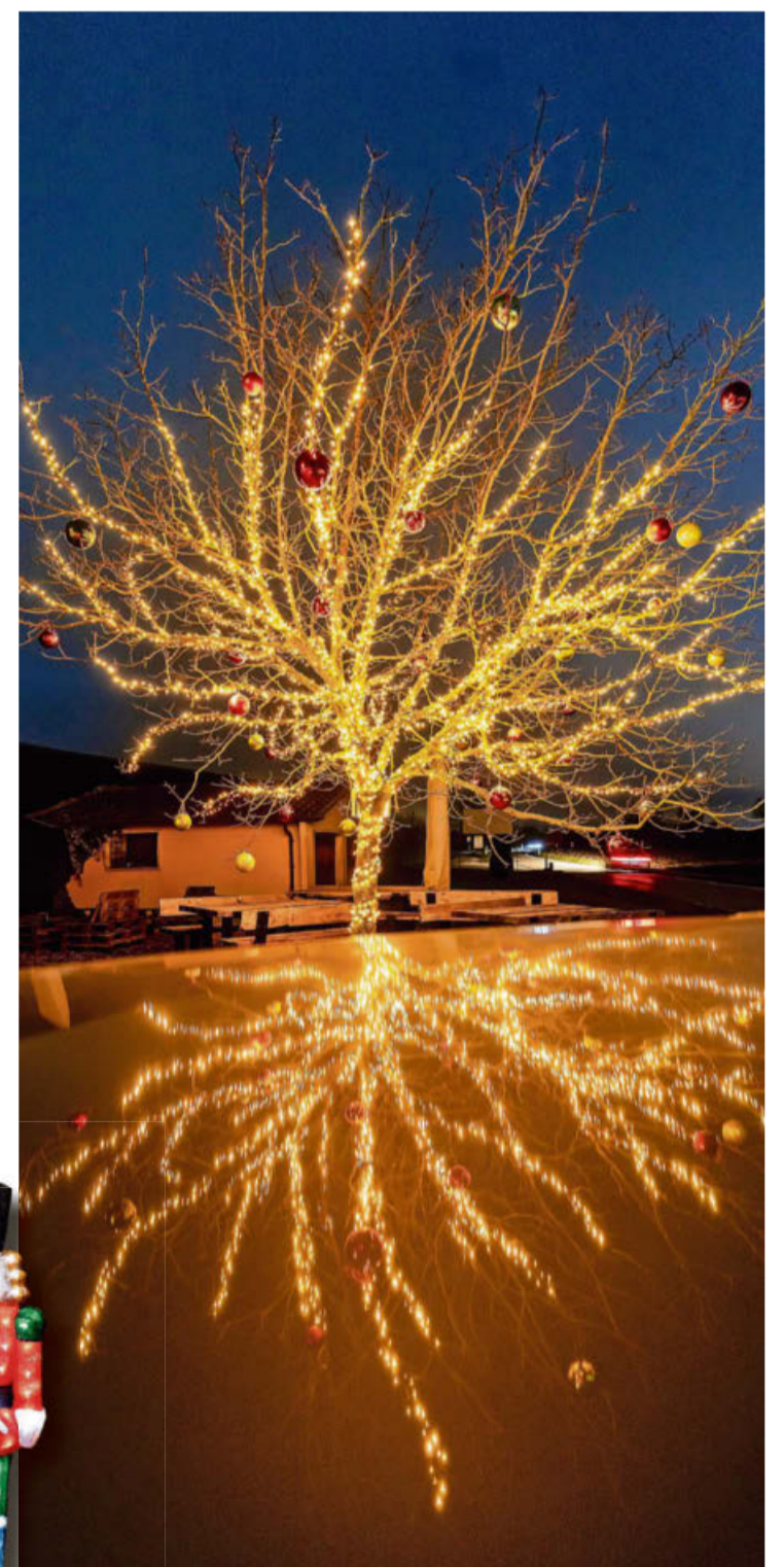
Hier wurde mit viel Liebe zum Detail geschmückt.