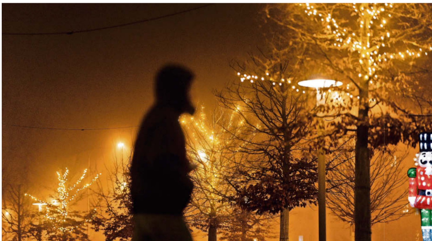
Passant vor beleuchteten Bäumen in Volketswil.