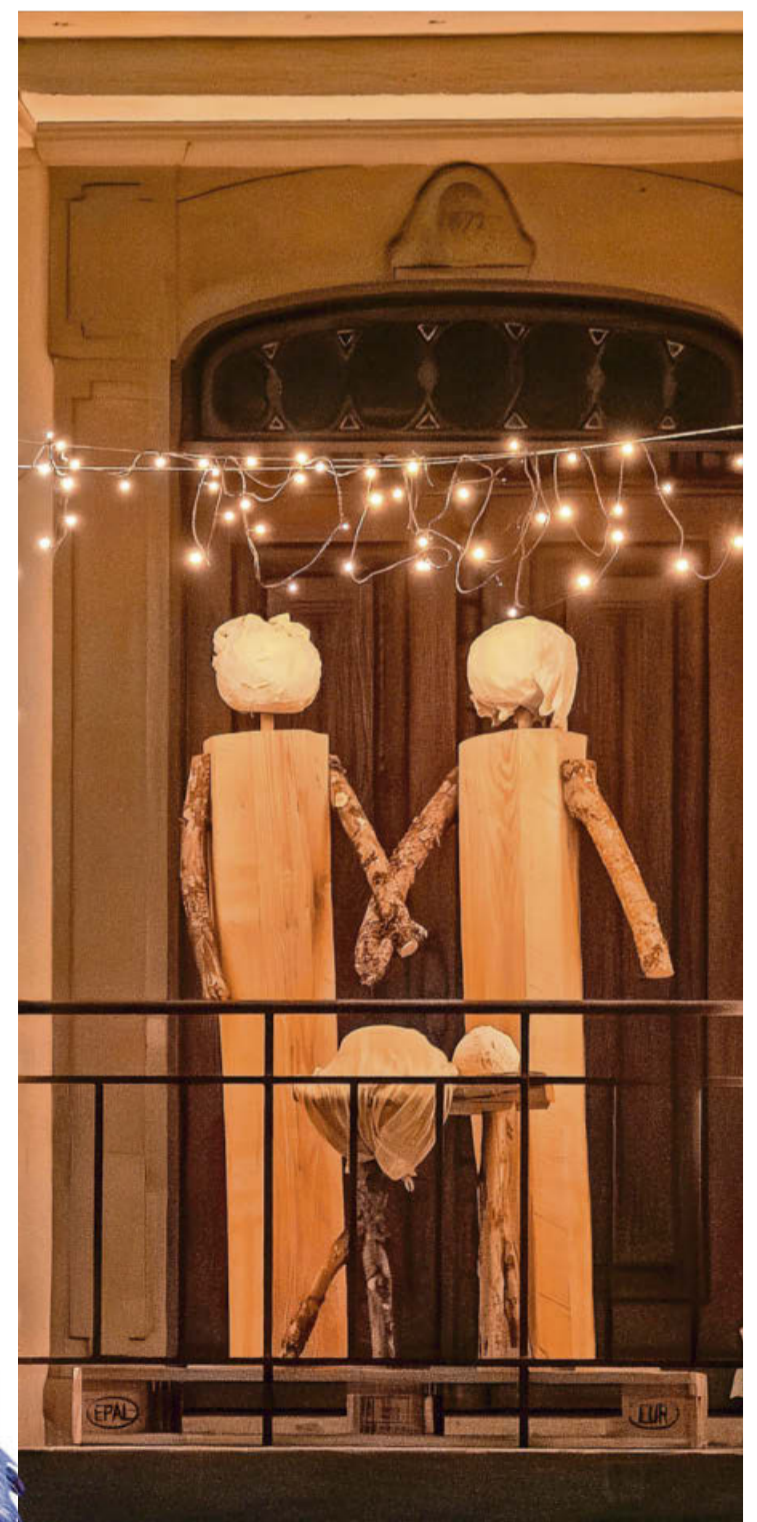
Hand in Hand: Die Krippe der Reformierten Kirche Turbenthal-Wila.