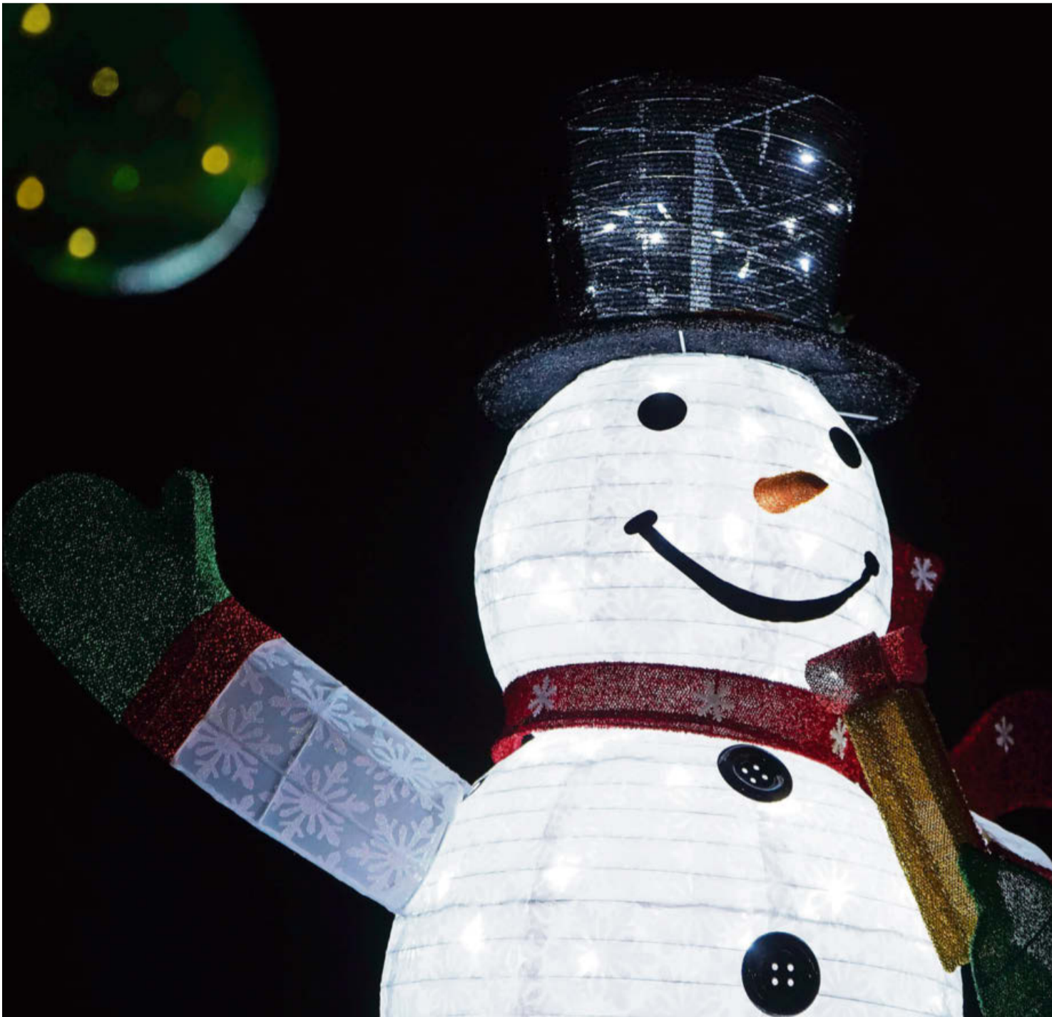
Der Schneemann grüsst aus Saland.

sich nur erfahren. Das Unsichtbare, das Übernatürliche gehört zur Dimension unseres Lebens, mit der sich alles entscheidet, aus der alles stammt. Wir leben heute in einer Zeit, in der das Sichtbare fast alles bestimmt: Besitz, Leistung, Konsum, äussere Erfolge. Und doch spüren viele, dass genau diese Dinge uns oft leer zurücklassen.