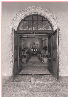
Bildlegende zum Titelbild «Heiliges Jahr» (Eingangstüre St.-Franziskus-Kirche).