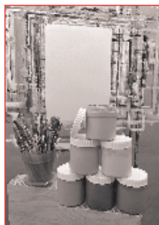
Bildlegende zum Titelbild «Farbe bekennen». Sie erteilt das Modul «Bibelmalen» für den Oberstufenunterricht 1 und 2.