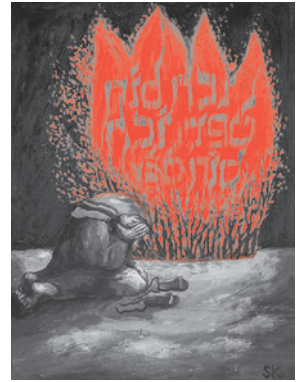
«Der brennende Dornbusch»