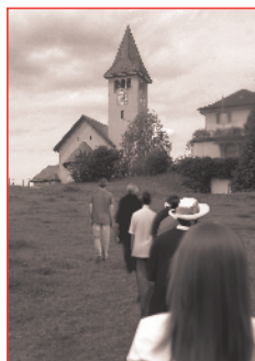
Bildlegende zum Titelbild mit dem Fokusthema «Neuland». Auf zu Neuem, auf zu neuen Ufern.