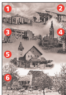
Bildlegende zum Titelbild mit dem Fokusthema «Ökumene». Die verschiedenen «Kirchen» in unserer Gemeinde: 1 FCGW Freie Christengemeinde Wetzikon, 2 FEG Freie Evangelische Gemeinde Wetzikon, 3 ICF Zürcher Oberland, 4 Reformierte Kirche Wetzikon, 5 St.-Franziskus-Kirche und 6 Heilig-Geist-Kirche.